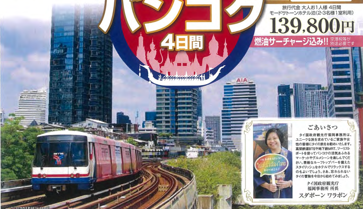
バンコク市内を走るBTS(イメージ)