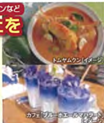
トムヤムクン(イメージ)

無形文化遺産に登録された トムヤムクンなどのタイ料理 タイ風海鮮料理、カオマンガイ、 フカヒレ・アワビご飯 をご堪能ください!!