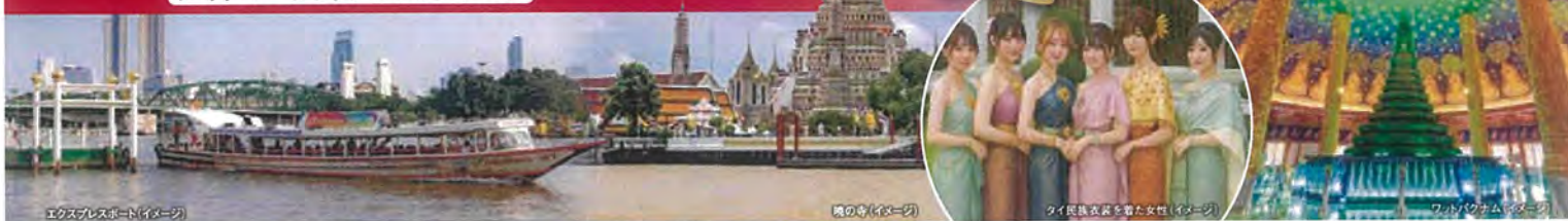
エクスプレスポート(イメージ)