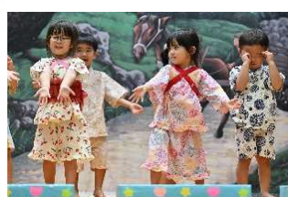
オペレッタ「虹」もがんばったね♡