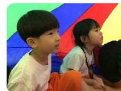
なんだかわくわくする～♡