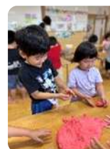
スライム、びろーんってのびて楽しい！！♡