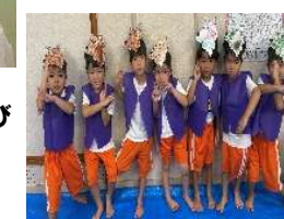
オペレッタに合奏あそびみんな上手にできたね♡