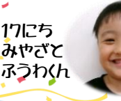
17日にち みやざと ふうくん