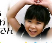
19日にち いしかわ まかなさん