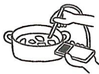
調理時の加熱の徹底（殺菌）