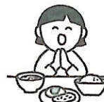
感謝の気持ちを育むマナー

給食の時間は、友達や先生と一緒に食べることで、協調性や社会性を育む大切な場です。「いただきます」「ごちそうさま」を通して、感謝の気持ちや食事のマナーを学びます。楽しい雰囲気の中で、食への興味を引き出し、自分で食べようとする意欲を伸ばします。