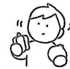
食べ物への興味・関心