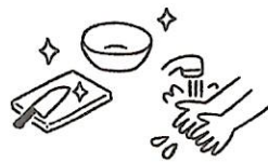
調理室での衛生管理