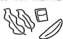
だしを活かした薄味の献立