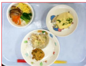
幼児食（アレルギー食も対応しています！）