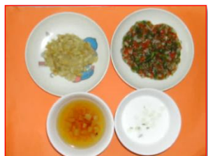
★離乳食は発達に応じて

また、離乳食やアレルギー症状等、一人ひとりの園児に合わせた内容で調理しています。