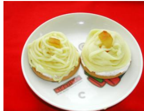
手作りモンブラン♡