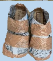
新聞紙と段ボール のスリッパ