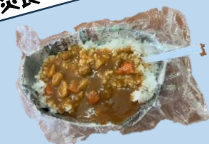
アルファ米と5年保乳レトルトカレー