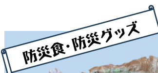
防災食・防災グッズ