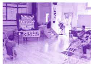
(よみきかせ くろうさぎ)