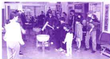
(小地域ふれあい事業)