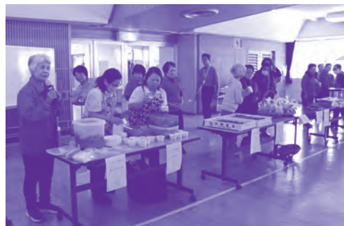
交流会でのミニデイのボランティアさんたち