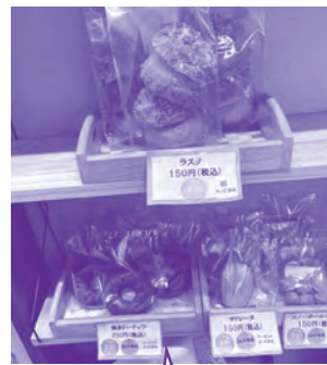
おかしランド(真志喜)