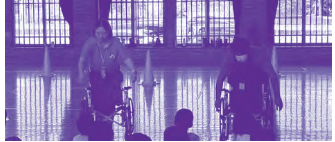
車いす体験(ふれあい介護センター、中城 愛誠園)