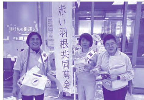
宜野湾市更生保護女性会