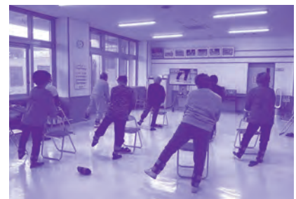
体操サークル寿樹の会(愛知区)