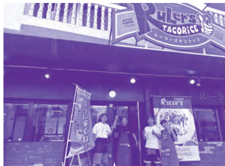
ルーラーズタコライス 宜野湾本店(大謝名)