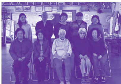
野ばら体操サークル(野高2区)

「通いの場」は、65歳以上の方が中心となって、地域の皆さんが定期的(週1回程度)に集り、健康づくりを行う場(自主サークル)です。地域の皆さんが気軽に集い、ふれあいを通して「仲間づくり」「生きがいづくり」「支え合い」の輪へ参加してみませんか?