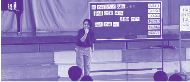
手話ってなあに(手話サークル和)

このふれあいを通して、障がいのある人の「ふだんのくらしのしあわせ」のために“自分に何ができるのか?”を子どもたちが考える機会となっています。この事業は、ボランティアさんや講師及び企業の協力を得て実施しております。