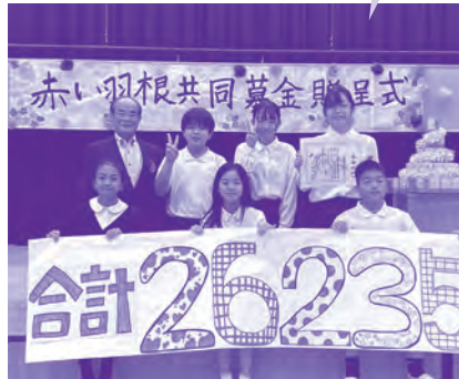
大謝名小学校の皆さん