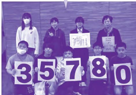
普天間小学校の皆さん