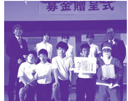
はごろも小学校の皆さん