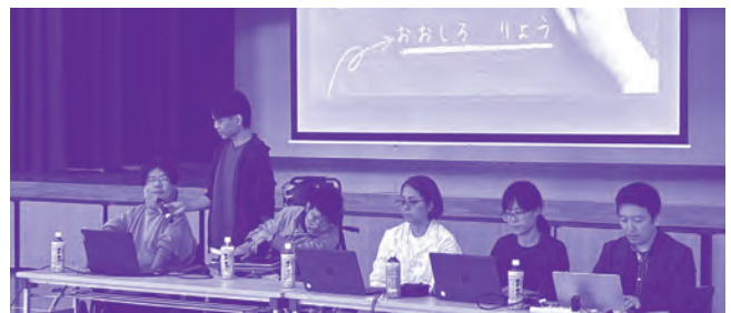
車いすユーザーの講話(沖縄県自立生活センターイルカ)