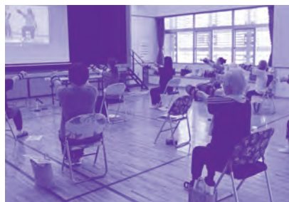
いけいけ百歳体操サークル(真志喜区)