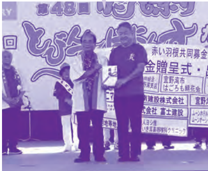
赤い羽根共同募金 出発式