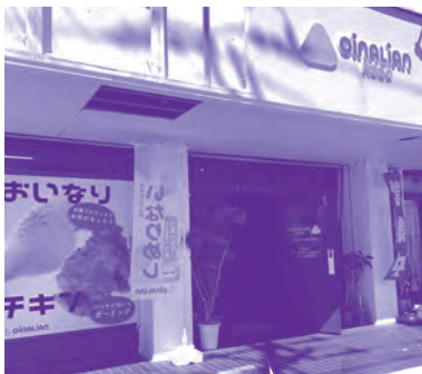
オイナリアン 宜野湾愛知店(愛知)

これからも、子どもたちへ食事を提供していくために、地域の加盟店に直接“みらいチケット(1枚約300円)”の 購入をお願いします。