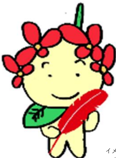
イメージキャラクター サンダンくん