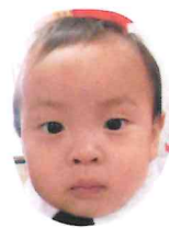
★(ほおらんくん)★ 《4月生》