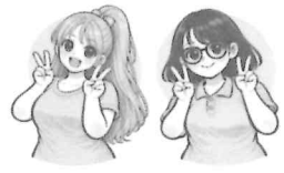
たまき たまい みう あやの