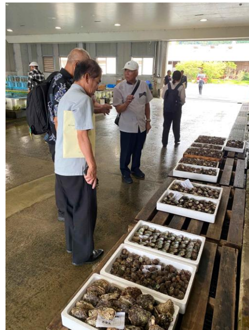
萩地方卸売市場視察研修

大会に付議された議案「令和8年度漁港・漁場・漁村・海岸整備予算の確保に関する件」については満場一致で採択されました。