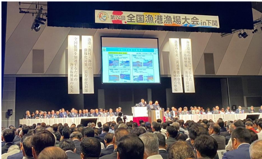
漁港漁場大会会場(海峡メッセ下関)