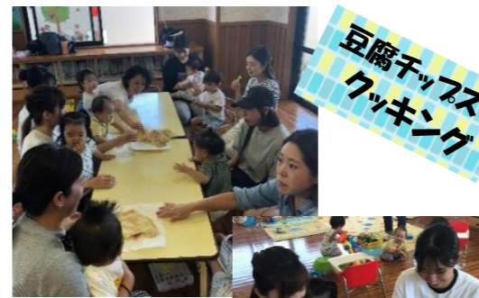
豆腐チップス クッキング

ママにあげる フーケの色、 何色にしようかな？ こっち！って、みんな 自分できめたよ！