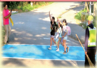
高江校あいさつ運動風景