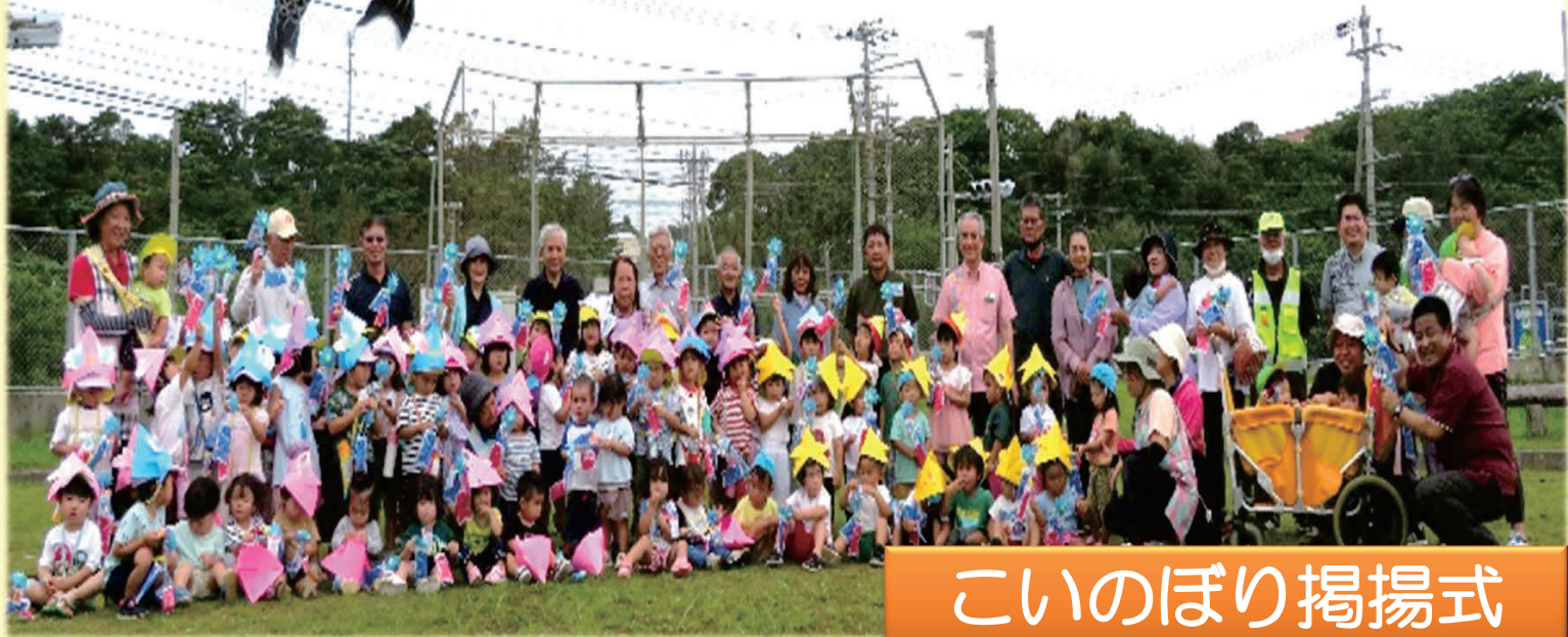
こいのぼり掲揚式