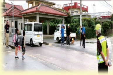
東校あいさつ運動風景