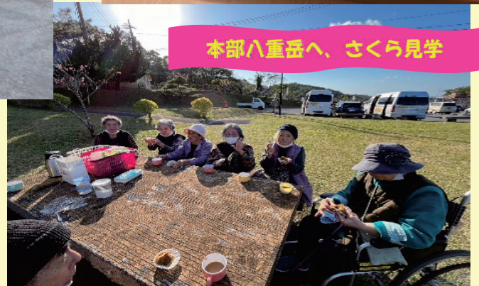
本部八重岳へ、さくら見学