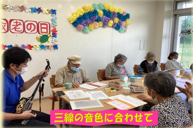
三線の音色に合わせて