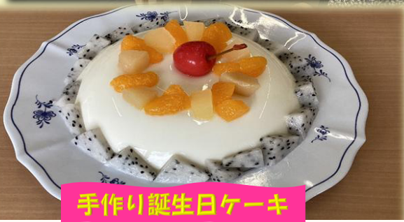
手作り誕生日ケーキ