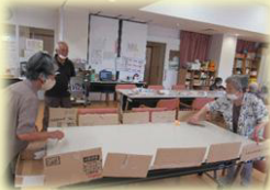
ゲーム～ピンポン入れ他～