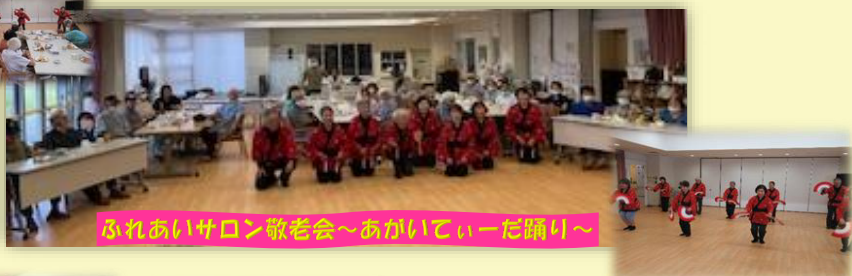
ふれあいサロン敬老会～あがいてーだ踊り～