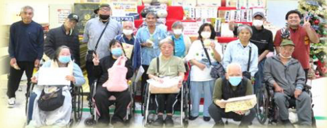
三村身協ポウリング大会