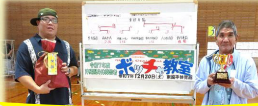
沖縄県ポッチャ大会 優勝！！