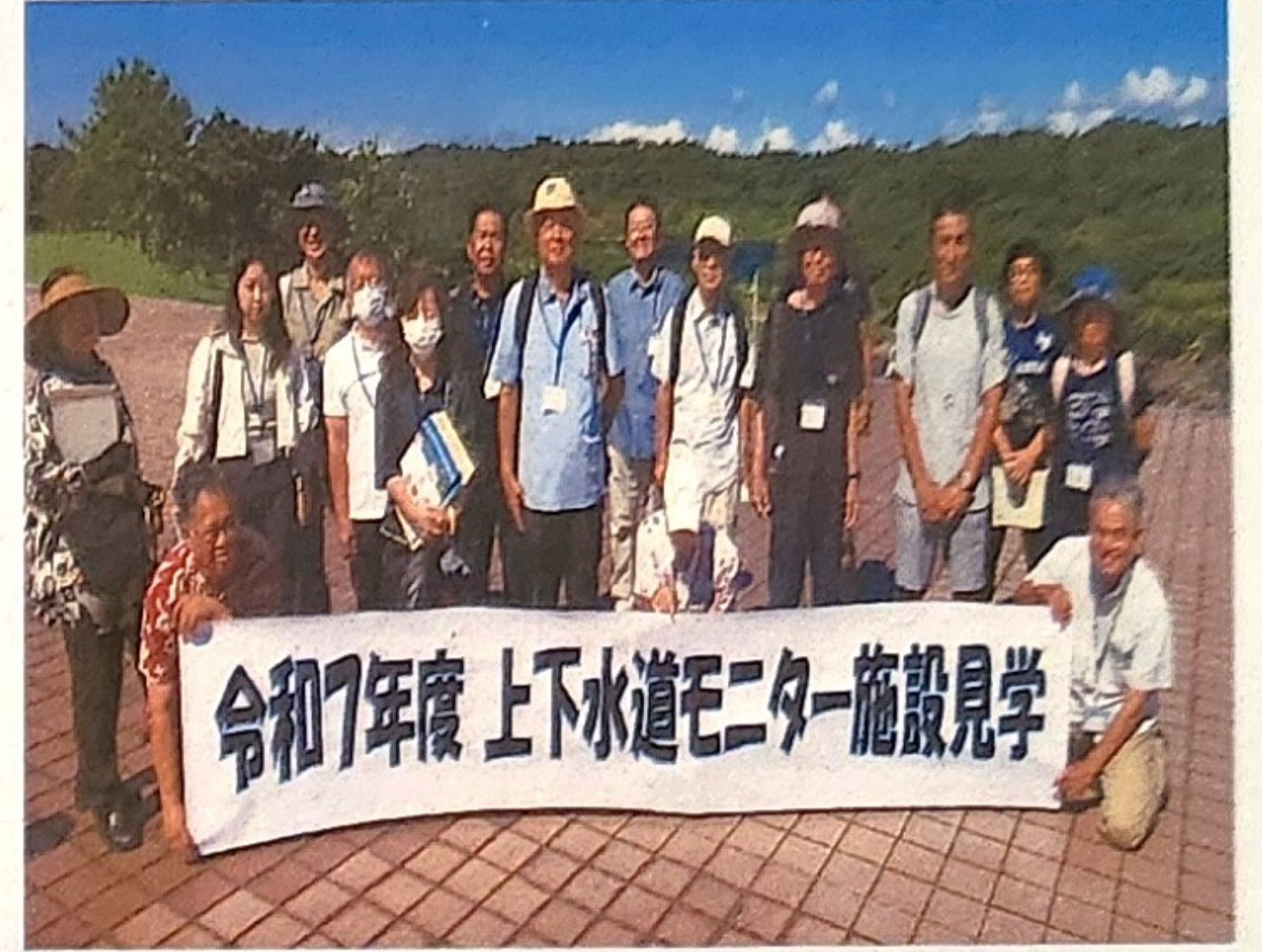
▲貸切バスで1日施設見学！（倉敷ダム）