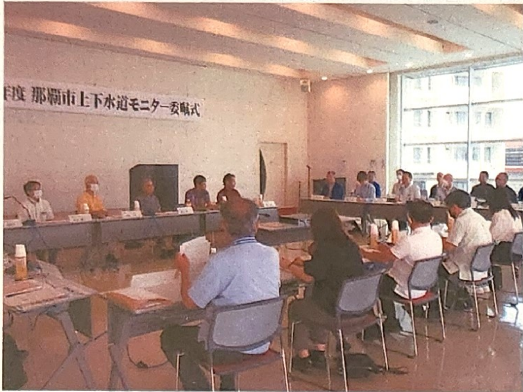
▲上下水道事業について、ご意見ご提案はありませんか？