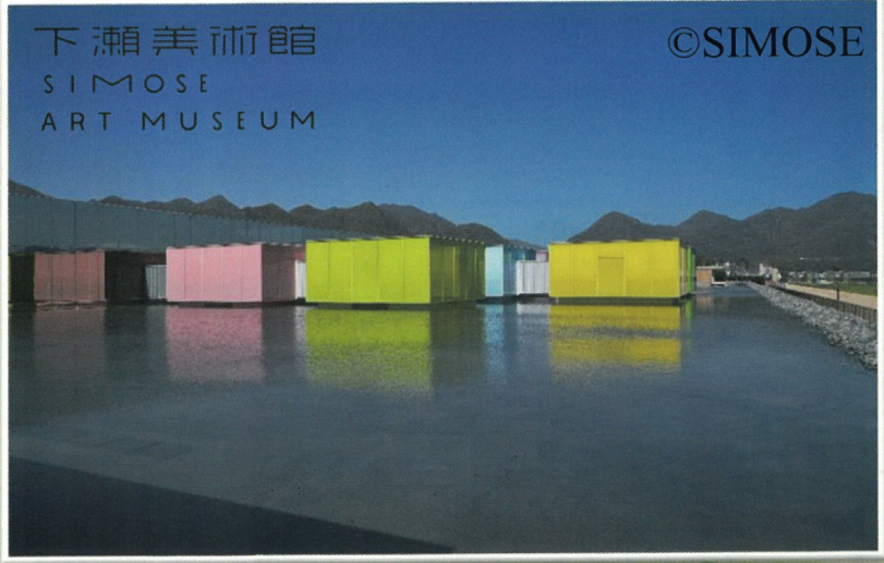
下瀬美術館 SIMOSE ART MUSEUM