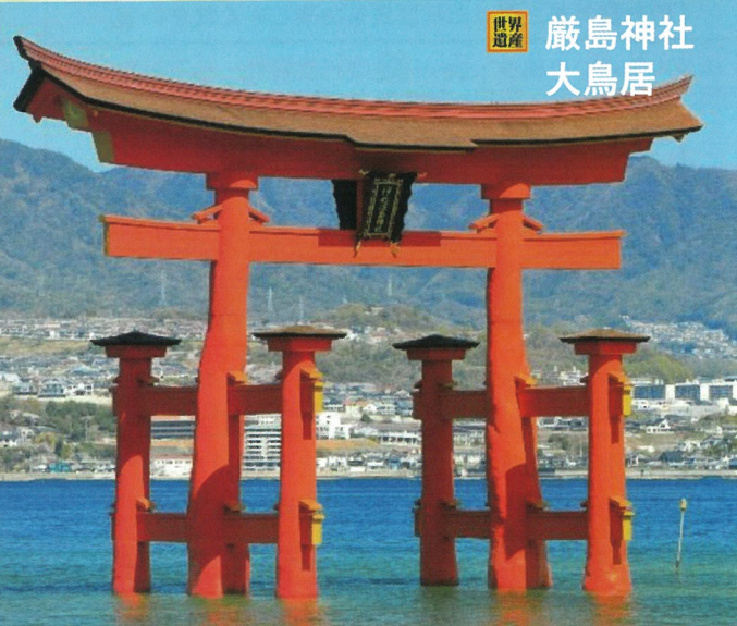
世界遺産 厳島神社 大鳥居