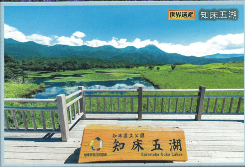
世界遺産 知床五湖