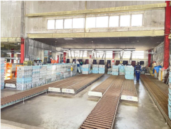
ビンリサイクルヤード