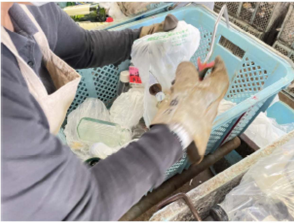
レジ袋を破袋し、ビンをカゴに出します。