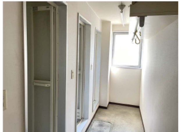
2階休憩室隣のシャワー室。どなたでも利用できます。