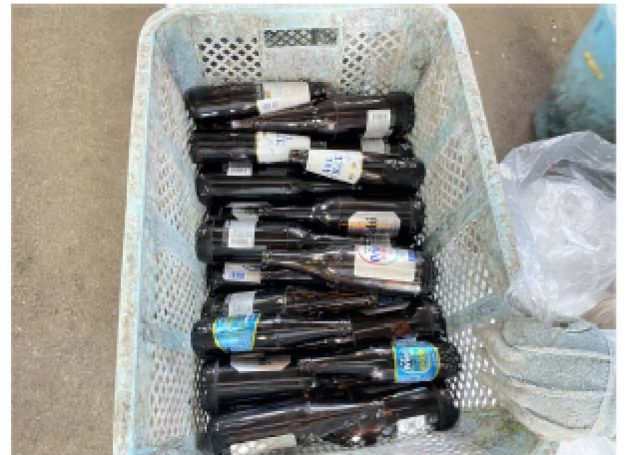
リターナブルビン（洗って再利用する）は、別カゴにストックします。※ビールビン