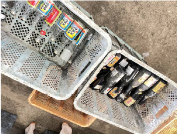
リターナブルビン（洗って再利用する）は、別カゴにストックします。※泡盛のビン