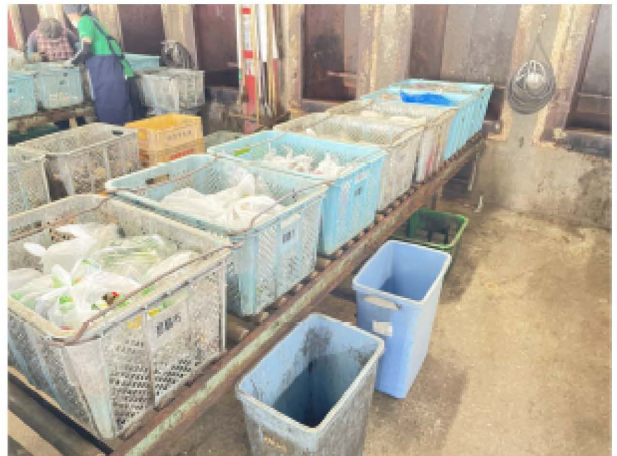
カゴを作業レーンに乗せて、リサイクル作業が始まります。