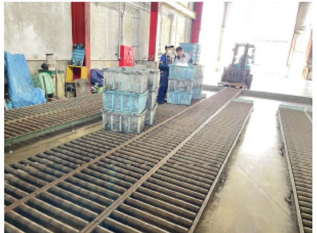
専用カゴにビンが入られてレーンを移動します。