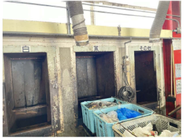
ビンを白（無色透明）、茶（茶色）、その他（その他の色）のコンテナに分別します。