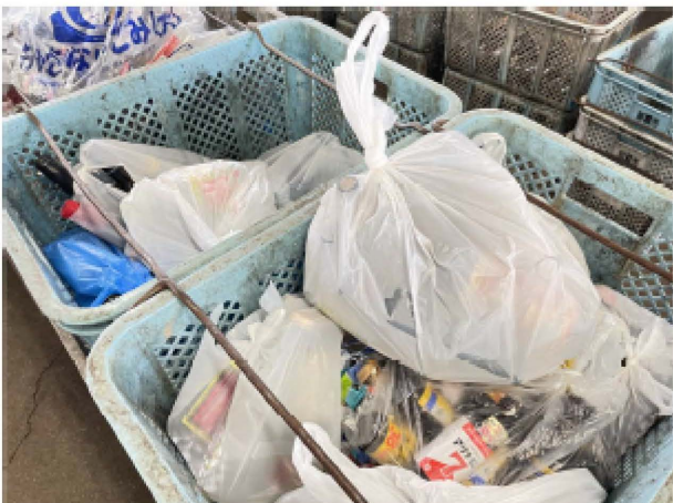
ビンのほとんどがレジ袋に入れられて出されます。