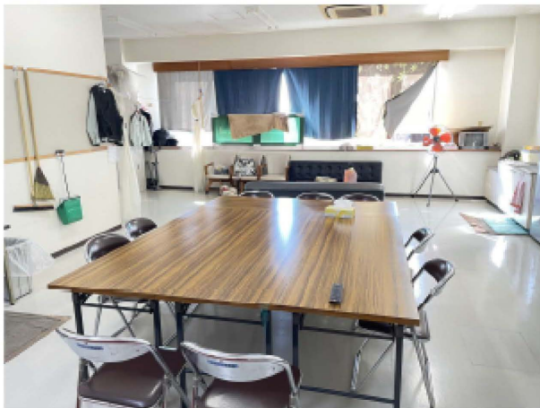
作業ヤード2階の休憩室です。エアコン完備、ベッドソファード2台、冷蔵庫完備。どなたでも利用できます。