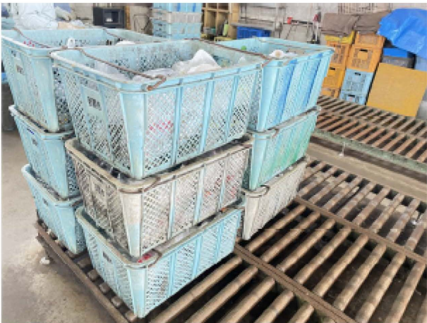
カゴが作業レーン手前まで移動します。