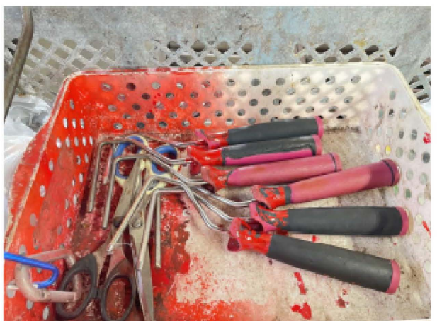
レジ袋を専用の工具で破袋します。