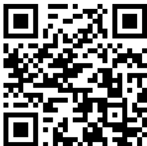
J P A公認の部