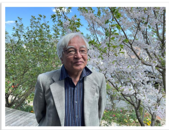
日本アジア国際教育センター

日本アジア国際教育センターは、単に日本語を学ぶためだけの学校ではなく、日本で生活していくために必要な社会・生活習慣や人間関係、マナー等を、豊かで美しい宗像の自然の中で身につけてもらう場です。そのため、代表のあいさつにもあるように、行政や地域コミュニティ、地元の学校や各種団体との積極的な交流を実施しています。そこでの経験を踏まえて、留学生の皆さんが日本への理解を深め、母国と日本の架け橋となり、また国際社会の平和に貢献できる人材となっただきたいと思っています。