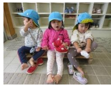
靴を靴箱に片付ける