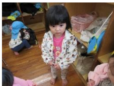
上着を着る・帽子をかぶる