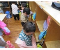
帽子・上着をロッカーに片付ける