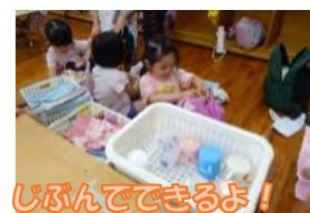
じぶんでできるよ!