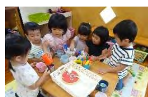
ともだちと一緒にがたのしいね