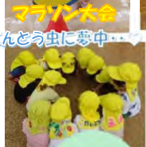
てんとう虫に夢中...