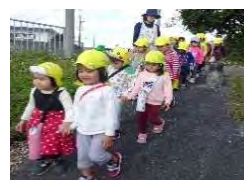
お散歩 決まりを守りながら たくさん歩けるようになりました