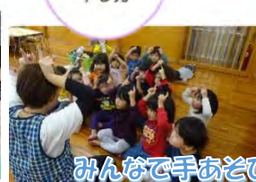
みんなで手あそび♪