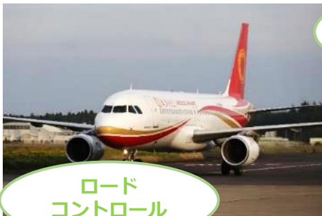
ロード コントロール