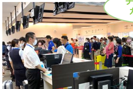
チェックイン カウンター