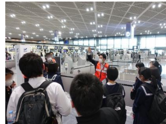
▲空港キャリア見学