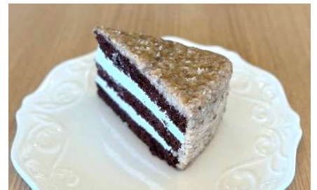
ジャーマンチョコレートケーキ ¥ 500 -