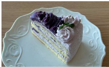
紅いもモンブランケーキ ¥ 460 -