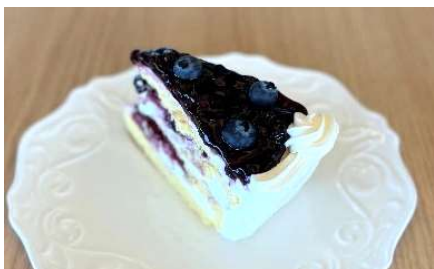
ベリーとヨーグルトチーズケーキ ¥ 480 -