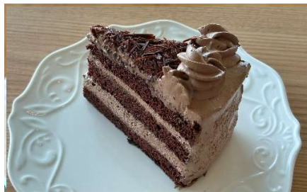
チョコレートガナッシュ ¥ 500 -