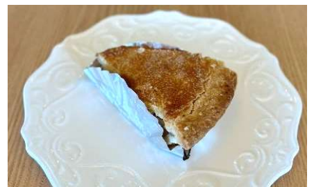
アップルパイ ¥ 430 -