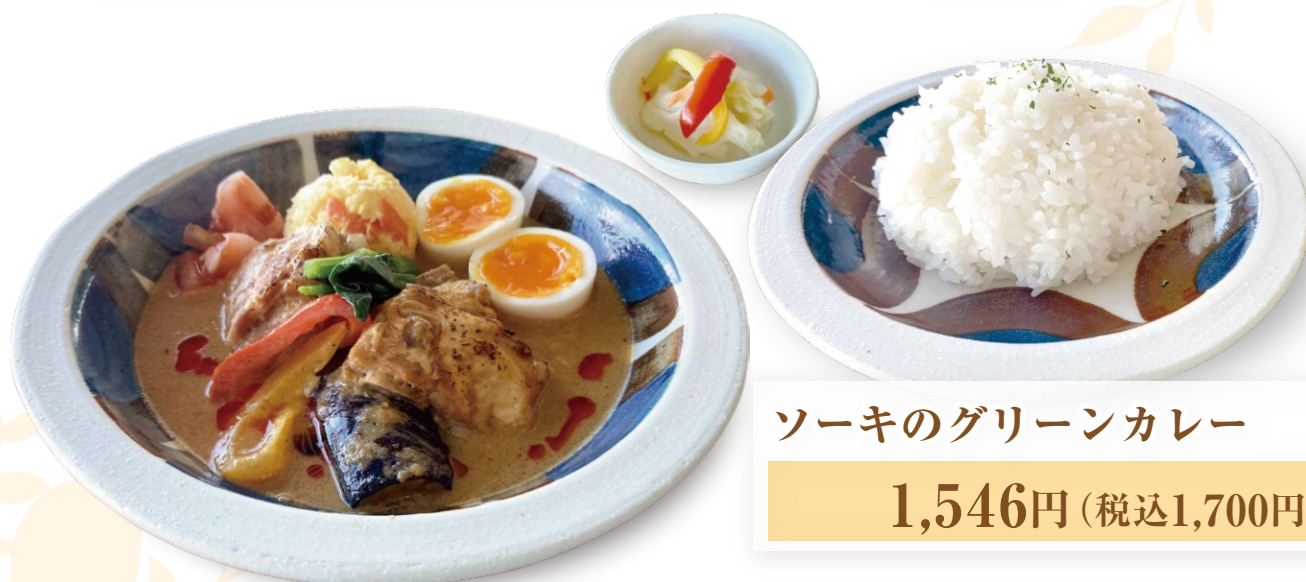
ソーキのグリーンカレー