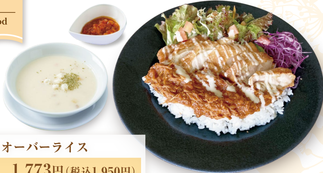
チキンオーバーライス