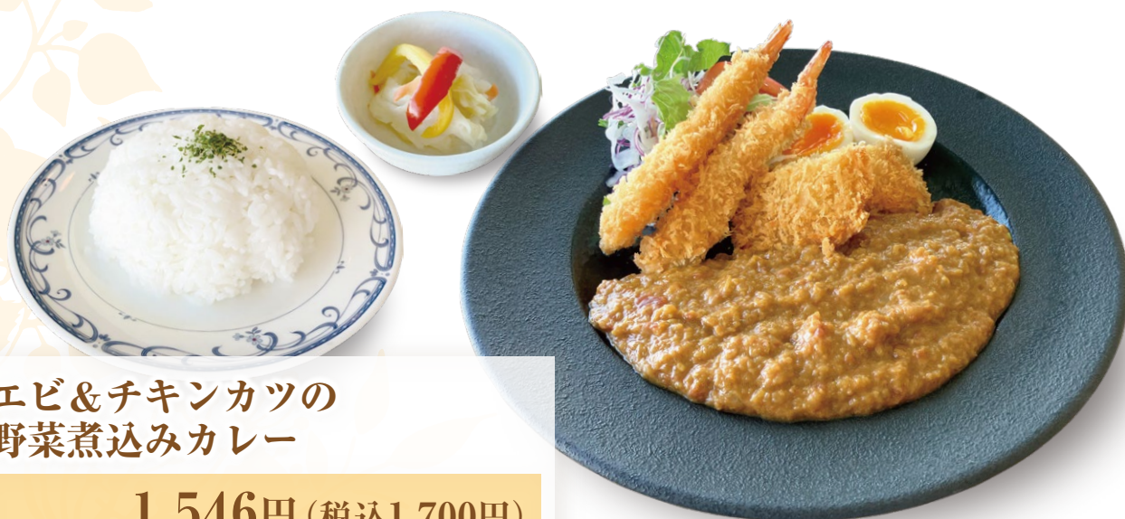
エビ&チキンカツの 野菜煮込みカレー