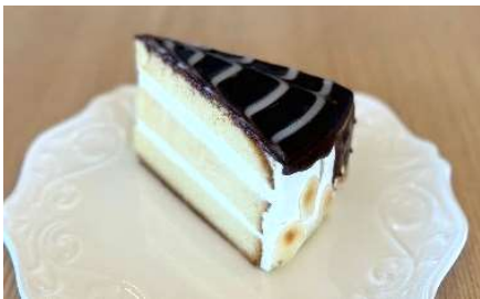
ボストンケーキ ¥ 550 -

メルローズのケーキを6種類ほど、ご用意しています。本日のラインナップはスタッフ またはショーケースにてご確認ください。