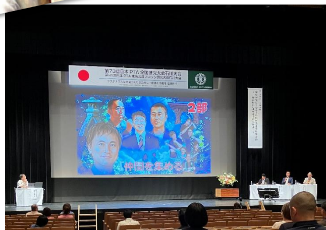
第5分科会会場：石川県立歌劇座 「劇団PTA」の皆さんが寸劇で問題提起しそれに基づいてパネルディスカッションが行われました