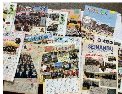
石川県内各校のPTA 広報紙