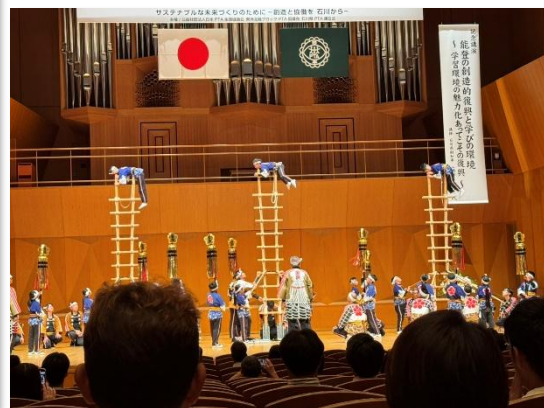
全体会会場：石川県立音楽堂コンサートホール 歓迎アトラクションは「金沢子どもはしごのぼり教室」の子ども達