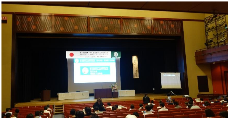
特別第1分科会会場：石川県立音楽堂 邦楽ホール 舞台上部の装飾が「和」の雰囲気を醸し出しています