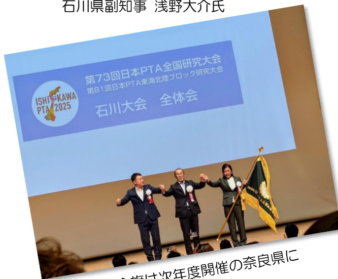
大会旗は次年度開催の奈良県に