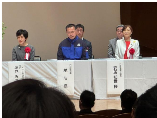
全体会来賓 左から文科省総合教育政策局長・ 石川県知事・石川県議会議長