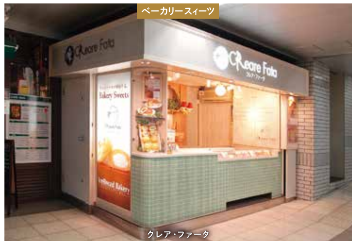
ベーカリースイーツ