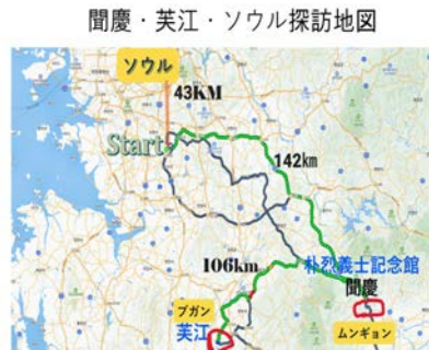
聞慶・美江・ソウル探訪地図