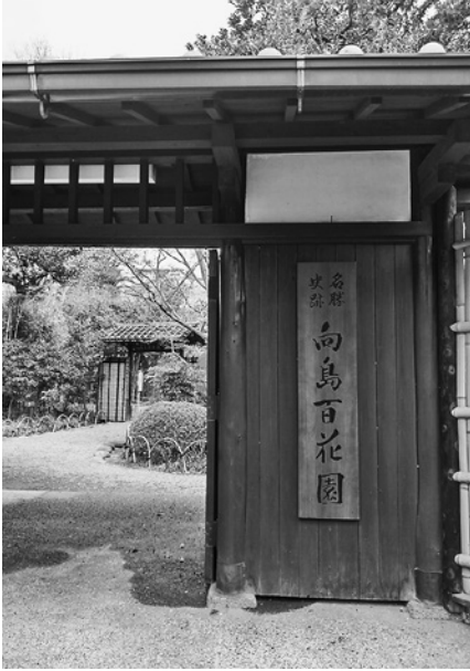
国名勝史跡「向島百花園」の出入口