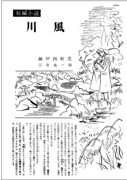
「新婦人」1957年1月号・153頁

スが一つはまることになり、最初期の短篇小説制作の本筋らしき流れを、「痛い靴」（『文学者』一九五五年五月号）↓「女子大生・曲愛玲」（『新潮』一九五六年十二月号）↓「川風」（『新婦人』一九五七年一月号）↓プレ「花芯」（『新潮』一九五七年十月号）と捉えられるようになった。上記四作品のうちプレ「花芯」をのぞく三篇が入っている第一短篇集『白い手袋の記憶』では、この流れとは逆の配列だったし、全集第九巻に至っては、出家（一九七三年十一月十四日）の前後数年間に書かれた二十四の短篇に拾遺の一篇を付け加えた内容で、二〇〇一年、当時七十九歳の作者が「この小さな小説の中に、その後の私の短篇の手法がすべて見えかくれしている。」との折り紙をつけて拾い上げた意義は大きいだけども、そこでの「川風」は前後の連関を失った孤立した作品として読まれるほかなかった。それを考えると、初出誌の判明は本作を新たな視点で読み直す好機である。