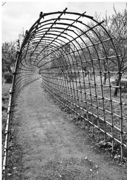
早春の百花園・萩のトンネル

再上京した瀬戸内晴美。しばらくして出会った小田仁二郎の指導のもとに小説勉強をつづけるなか、その小田と、荷風文学の舞台を訪ね、瀬東への半日の行楽を愉しんだ日があったのではないか（※「川風」には、文江が小峯のオーバーのヘムのほつれに気づき、いつも携帯している安全ピンで留める場面がある。男の疲れた後ろ姿にささいな異変を一瞬にして発見するあたり、歳は十八ながら、成熟した三十路女性の目を感じさせる）。