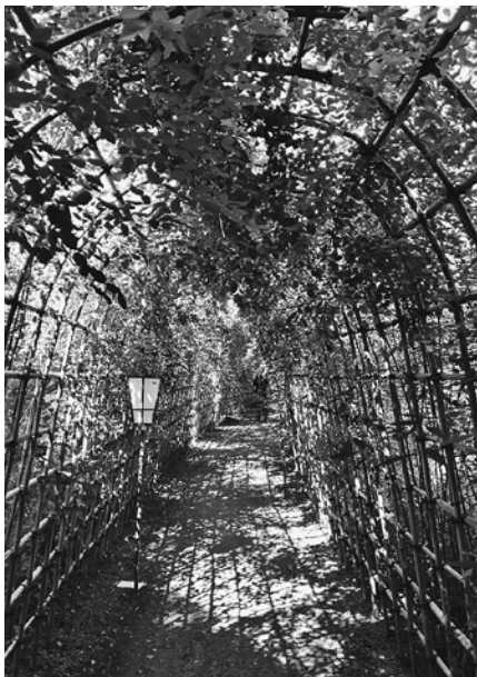
秋の百花園・萩のトンネル

上、浅草と玉の井（現・東向島五丁目のあたり）が切りはなせない関係にあったこと、歩くにせよ乗物を使うにせよ、文のうえでは省筆により二点を最短で結べることを示している。私娼街として栄え、戦災に遭ってほろんだ玉の井から、隅田川寄りに大きく外れた地に残る百花園だが、最寄り駅は東武伊勢崎線の「玉の井（現・東向島）」だ。また、『濯東綺譚』というテクストのなかに「百花園」の三文字は見当らぬものの、先に引いた九章末尾のくだりに出てくる「地藏坂」や「地藏尊」は、今に伝わる鞠場（菊場）の庭と指呼の間にある。一九五一年の五月、出奔後足かけ四年にわたった京都暮しを経、作家を志して