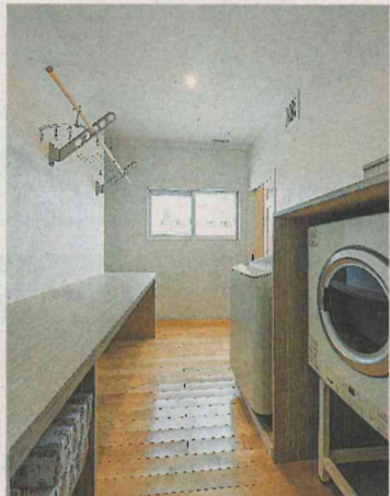
2階のインナー物干し。家族収納と浴室の間にあり、洗濯機と乾燥機を横並びにして家事効率を高めた