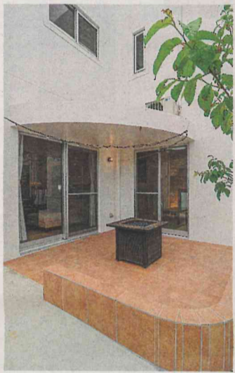
リビングと和室に隣接するタイル張りのテラス。バーベキューを楽しんだり、DIYスペースとしても活躍する。曲線を描くひさしも印象的だ