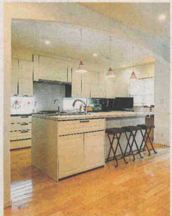
シンプルなモールドリングが施された扉が特徴の2列型のキッチン。白で統一して、さわやかな印象。右奥は夫人のワークスペースになっている

「扉がないから換気が良く、コスタダウンにも。物も出し入れしやすい。子どもたちが成長した時、身一つで部屋への入れ替えができるのも利点」。通路には天窓を設け明るさを確保。東側のインナー物干し場は、洗濯機と乾燥機を横並びに置いて利便性を高めた。