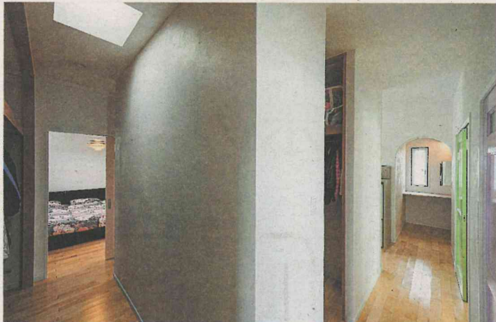
2階中央部に設けた家族収納。左奥に見えるのは寝室。扉を設けず、通り抜ける造りなので、移動しながらの片付けもしやすい