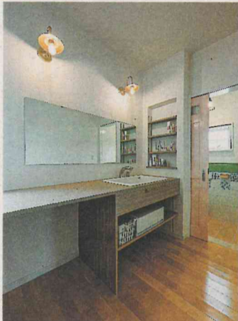
2階の洗面室。6人で使うため、洗面台も空間も広々。奥はトイレ