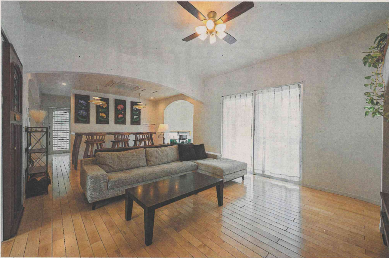
掃き出し窓から柔らかな光が届くリビングダイニング。木工房で作ってもらったダイニングセットなど、お気に入りの家具が楽しい集いを演出