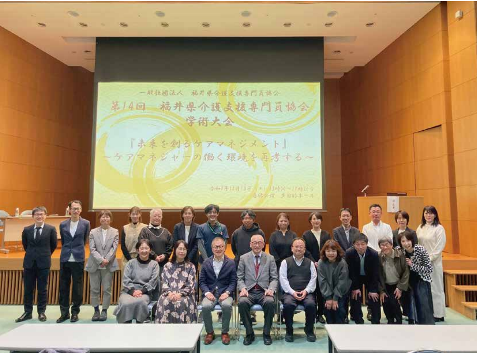
《令和7年12月13日(土) 福井県自治会館》