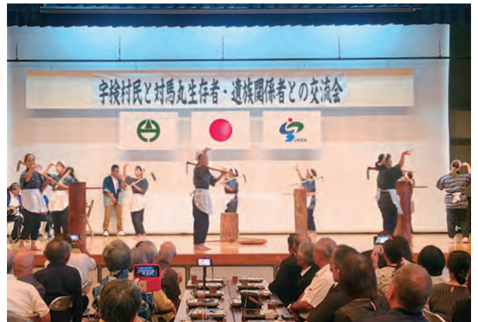
伝統芸能「稲すり節」