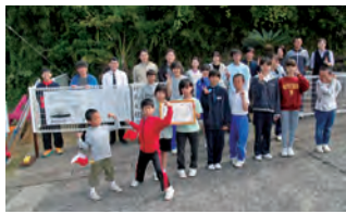
悪石島学園の子どもたち

奄美大島から鹿児島への移動日と悪石島行きフェリーの運航待ち、日程調整などに時間を費やしました。悪石島へは三つの目的がありました。①海上慰霊を行う②悪石島学園へ感謝状の贈呈③慰霊碑の解説板の取り付けでした。記念会があらかじめ用意し郵送していた慰霊碑の解説板の取り付けは、フェリーが欠航となり