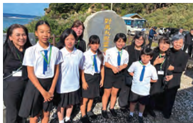
しま丸 児童合唱団