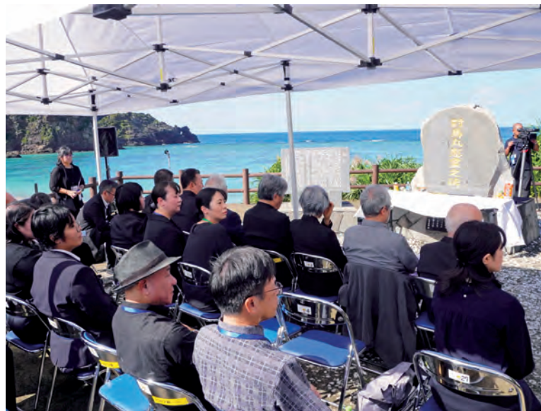
船越(ふのし)海岸でおこなった慰霊祭