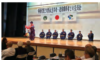
琉球古典愛好会 の会