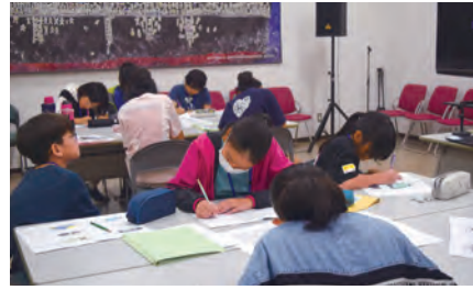
記念館で事前学習中