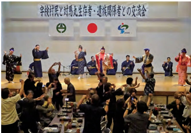
沖縄から訪問した芸能団