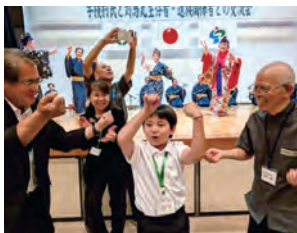
みんなで楽しくカチャーシー♪