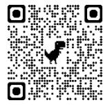
母子プログラム サポーター募集