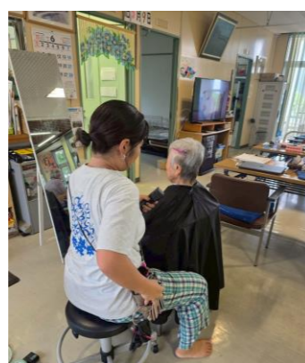
散髪ボランティア