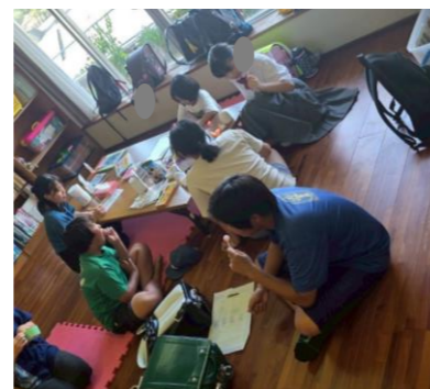
座間味・阿嘉慶留間 子どもの居場所備品購入

その他、老人・障がい・児童福祉、 ボランティア活動事業で 令和7年度も大切に、使わせて頂きます。