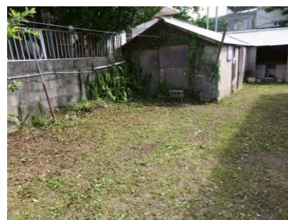
しまサポ 高齢者宅の草刈り作業