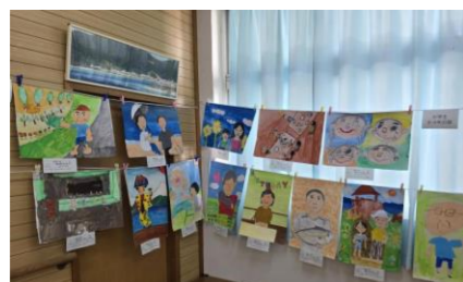
お年寄りの絵 コンクール

その他、老人・障がい・児童福祉、 ボランティア活動事業で 令和7年度も大切に、使わせて頂きます。