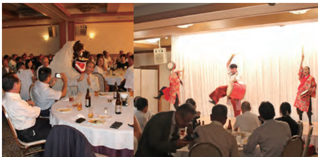
▲意見交換会での一幕