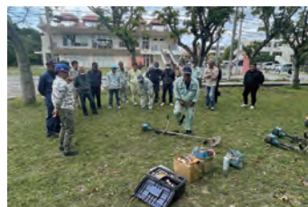
◀刈払機安全衛生教育講習の様子