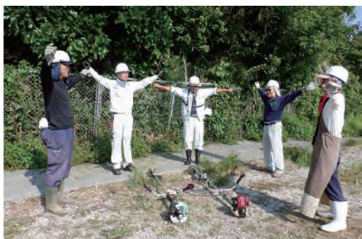
▲就業前の準備運動