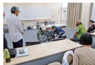
介護補助スタッフ講習の様子