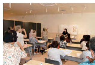
保育補助スタッフ講習の様子