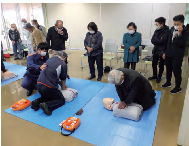
▲救命救急講習のーコマ