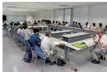
◀女性会員拡大のためのワーキンググループの様子