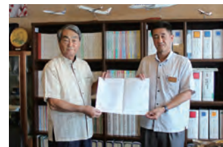
▲沖縄労働局長・沖縄県知事への要請の様子