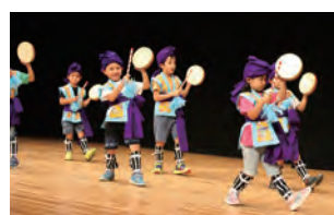
あさのうら保育園の園児による かわいい演舞でスタート！