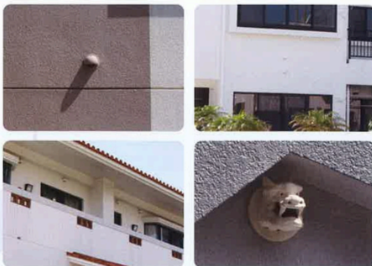
注：当社製品をご使用の場合は、用途に適した換気口フードをお選び下さい