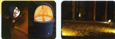
※ランタンは受注発注の製品です

ランプシェードとしてもお使いいただけます。お庭の素敵なエクステリアとして人気です。