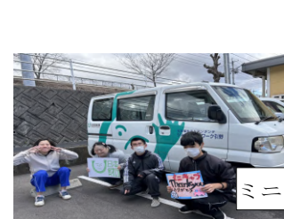
ミニキャブ号→フルーツ号