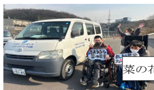
菜の花号→ブギウギ号

2月は送迎車の入れ替えが3台行われました。ブーケのリサイクル業務やリズムJOYの送迎車としても利用された『菜の花号』、あーすの外回りなどに使用された『ミニキャブ号』、生活介護の送迎やお出かけで使用した『セレナ号』が廃車となりました。また、新しいアンダンテの送迎車をそれぞれ『ブギウギ号』『フルーツ号』『ポンチ号』と名付け、今までの3台の後を継いで活躍してもらいます。