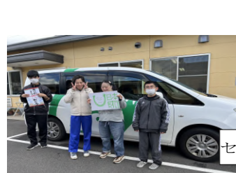
セレナ号→ポンチ号