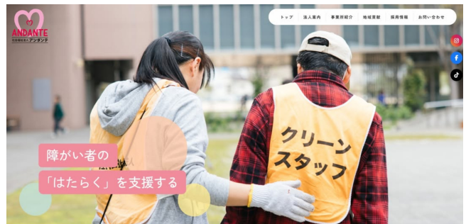
障がい者の「はたらく」を支援する

理事長や職員とどんな内容やメッセージを伝えたいか議論を重ね、2日間かけて職員の働く姿・職場の活気ある様子を撮影しました。当法人らしい明るいホームページになりました。ぜひご覧ください！！