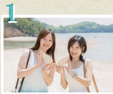
売店で絵馬を買おう!