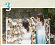
絵馬かけに結ぼう! ヒモはしっかり結んで