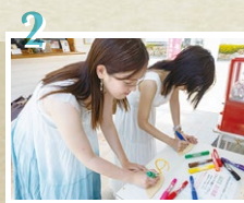
絵馬に想いを乗せてメッセージを書こう