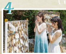
想いを込めてお願いしよう!