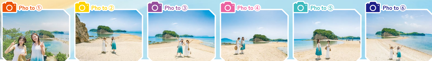
道に被写体が被らないように