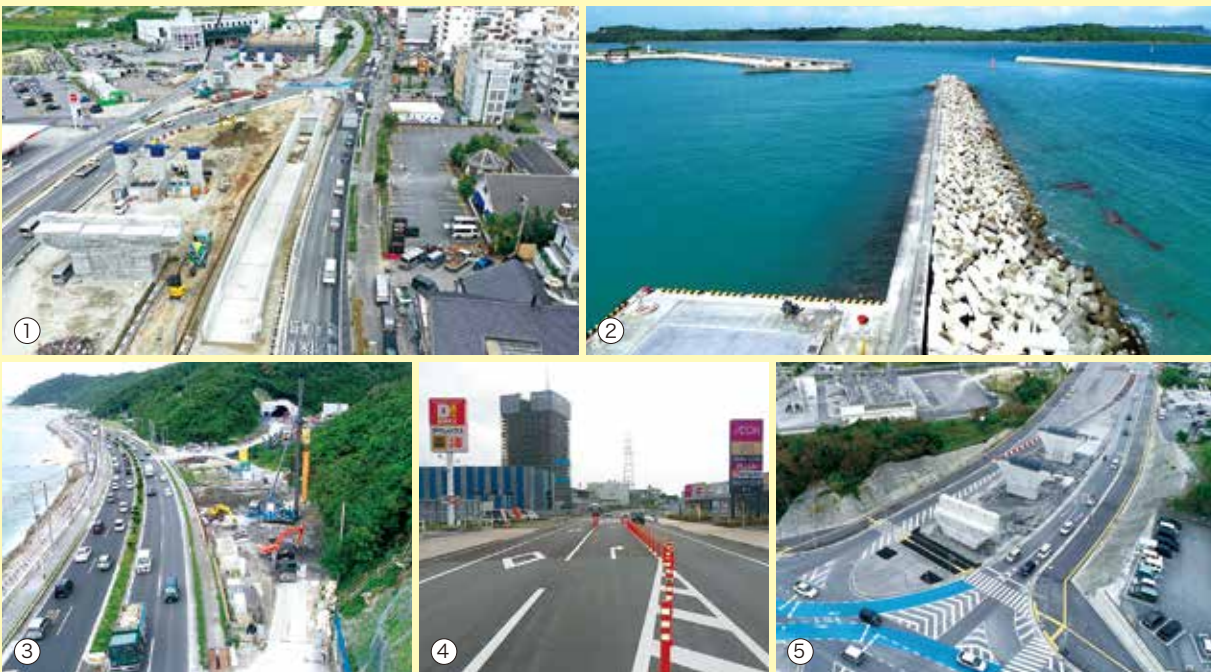
①小禄道路瀬長 OFF ランプ擁壁工事 ②平敷屋漁港第 1 防波堤機能保全工事 ③名護・数久田地区地盤改良工事 ④てだこ浦西駅前道路舗装工事 ⑤与那原橋下部工事

限られた県土を開発するのも私たちの仕事です。 自然と向き合い、土地を拓き、防災を果たすのも 建設業の大切な役割です。