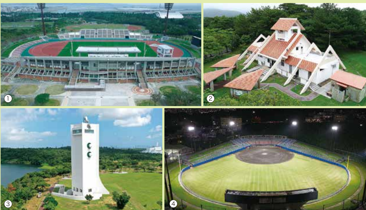
①県総合運動公園陸上競技場改修工事（外構） ②沖縄県民の森大規模改修工事 ③倉敷ダム監視通信塔建築改修工事 ④浦添市民球場夜間照明整備工事

人々が生活を営む空間を創る。それが建築です。 大型事業から個人住宅まで、一つひとつの個性と 向き合い、空間創りをサポートします。