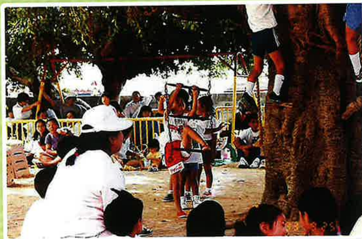
園庭で行われていた運動会。伝統種目!ガジュマルの木登り