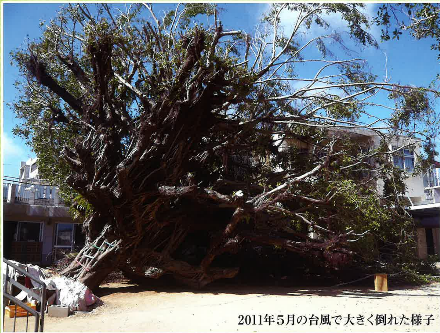
2011年5月の台風で大きく倒れた様子