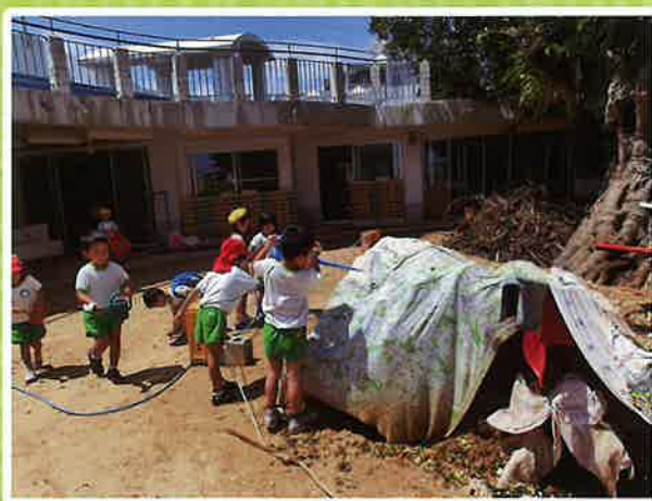
倒木後の清掃 子どもたちも一緒に。