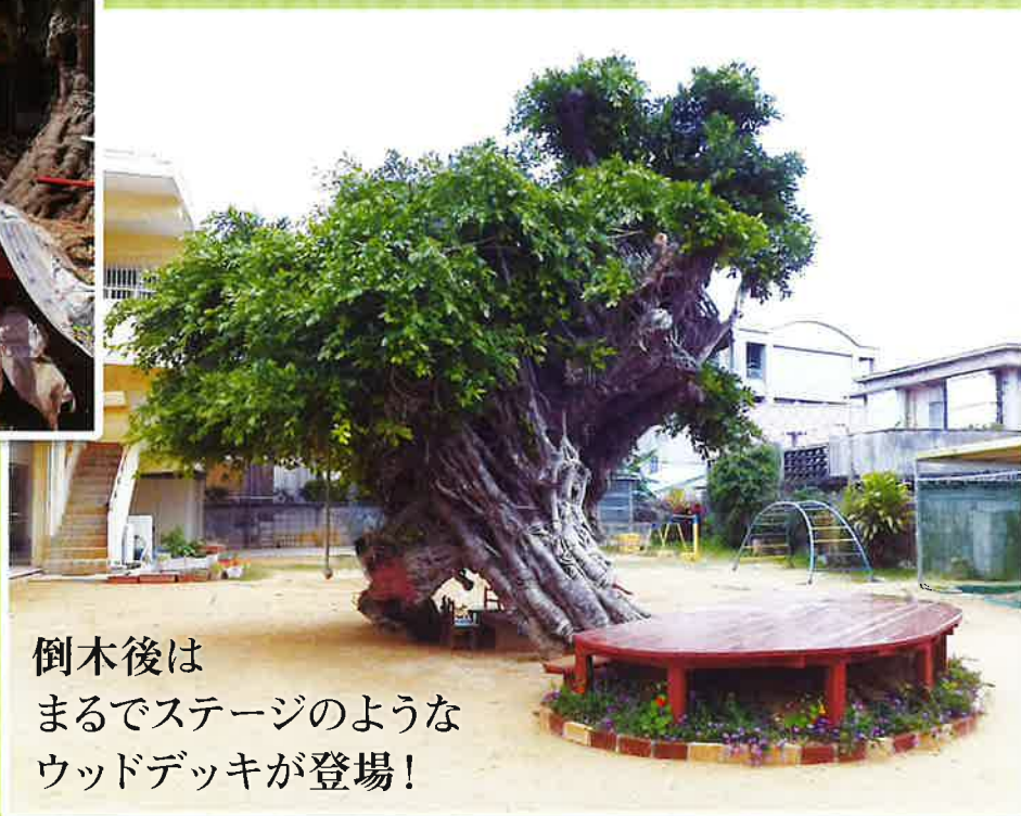
倒木後は まるでステージのような ウッドデッキが登場！