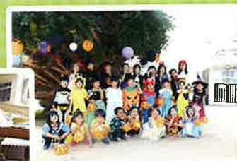
今もなお、 様々なイベントの中心に