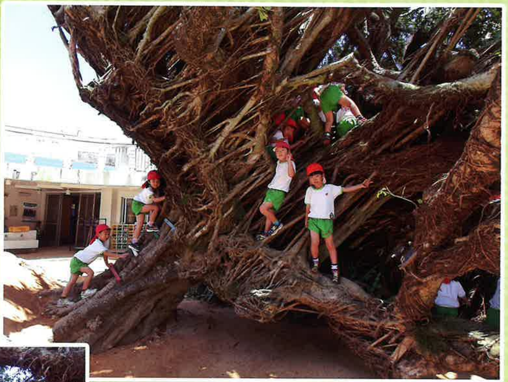
冒険だー!ここも登れるね!