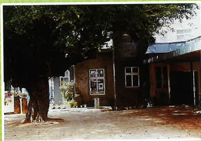
旧園舎と親ガジュマル