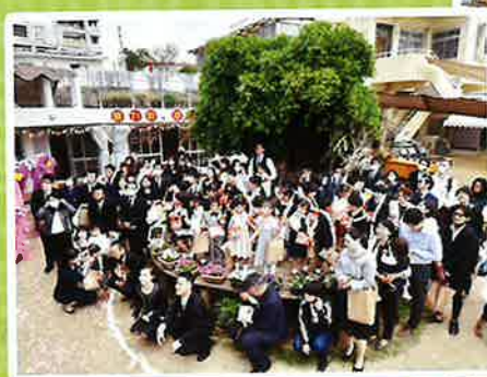
卒園記念写真は毎年 親ガジュマルを囲んで