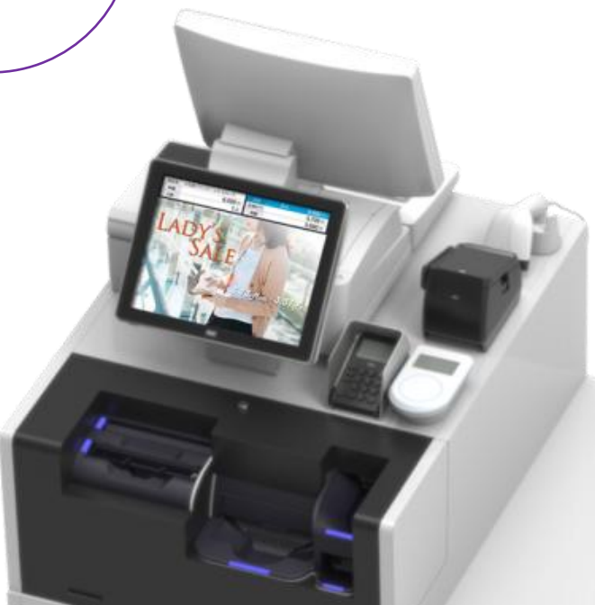
対面セミセルフPOSレジ