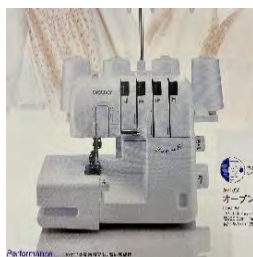
KagariIV 4本糸ロックミシン オープン価格