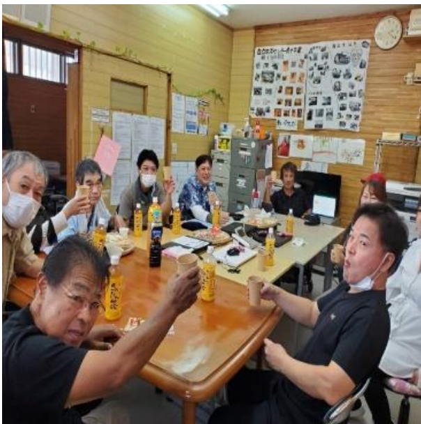
ゆんたくカフェ参加者

10月19日(土)、石垣市にてゆんたく会を自立生活センター南十字星で開催しました。今回の会では、脊髄損傷者や車椅子ユーザー、訪問介護、介助者等、13名参加してくれました。そこでは、社会参加や日常生活での介護のことや、自立生活センターの活動や運営など関心を持つ方もいて、いろいろな話題があり、ざっくばらんに語り合えたと思います。 特に、車椅子でも店やディスカウントショップでの買い物のしやすさや不便さについて語り合い、参加者それぞれが感じている日々の課題や経験が共有されました。また、障害を持った当初の困難な時期から、現在に至るまでの苦悩を乗り越えてきたエピソードも語られましたが、今では多くの協力者となつたり、当時の苦労話も笑い話として語り合えていました。参加者の皆さんが共感し合い、笑い合える場となったことがとても印象的であり、今後もこうした交流の機会を続けていきたいと感じました。