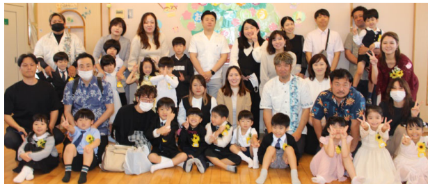
ひまわり（幼稚園児）